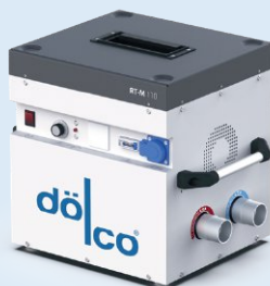
Regulowany osuszacz podposadzkowy z pojedynczą turbiną RT-M 110/D.1/D