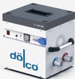
Sprężarka bocznokanałowa SKV 230-VM