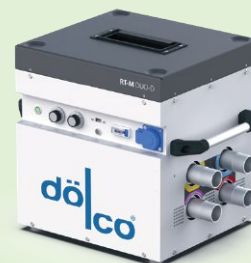
Regulowany osuszacz podposadzkowy z podwójną turbiną RT-M Duo/E/D